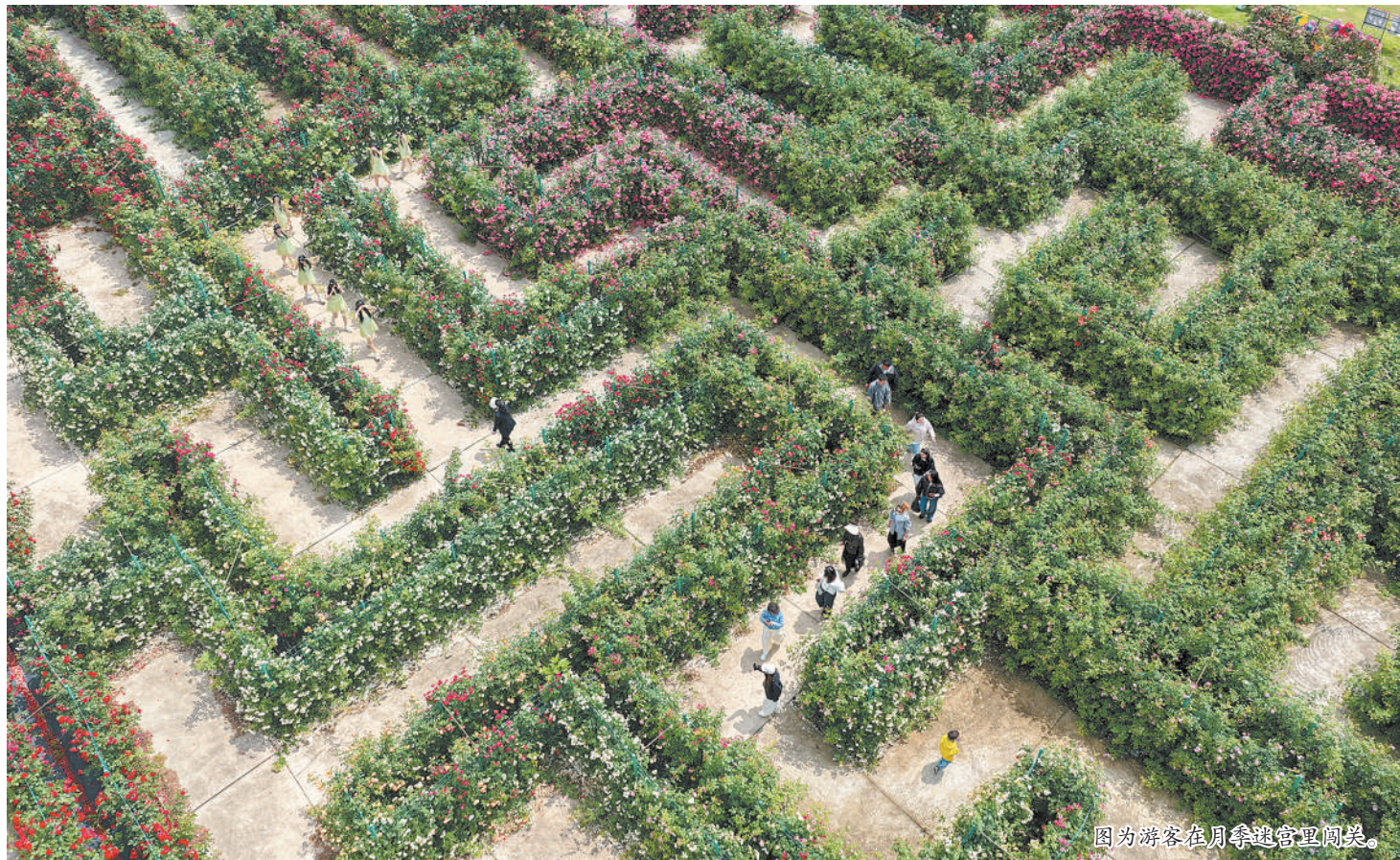
图为游客在月季迷宫里闯关。

“五一”小长假，人们纷纷走出家门、亲近自然、放松心情。作为国家AAAA级旅游景区、中国十大优秀国际乡村旅游目的地、浙江省5A级景区镇，花园村凭借丰富的文旅资源和优质的服务保障，精心策划集赏花、游乐、休闲于一体的假期活动，吸引游客在沉浸式体验中感受乡村振兴的丰硕成果，度过一段充实而美好的欢乐时光。