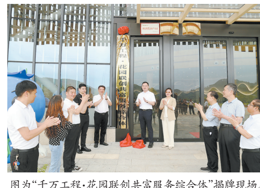
图为“千万工程·花园联创共富服务综合体”揭牌现场。