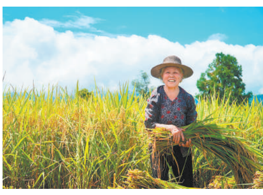
《丰收喜悦》 水稻喜丰收，村民笑开颜。