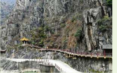
(曾毓琳) (作者系东阳市作家协会副主席)

而你始终于昼夜晨昏中缄默如山 你的呼吸比星月迷失的黑夜更深沉 你从不在意王朝的兴衰与更迭 蜀地千百年荣光因你而葳蕤