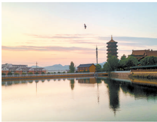
《相映成趣》 南山寺的万福塔、湖面上的小鸟以及远处的村民住宅出现在同一画面里，相映成趣。 拍客：邵宏杰