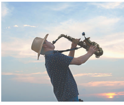
《沉醉》 晚风吹拂，曲调悠扬，沉醉在优美的旋律中。

图片内容：1、积极向上；2、吸引读者；3、标新立异，不得抄袭；4、附上图片题目、说明、拍摄地点、时间等信息；5、注明拍客的姓名，联系方式及通讯地址等详细信息。 投稿方式：1、发送邮件到 hjyjtbs@qq.com 2、加 QQ1084748346 发送离线文件。我们每期将挑选3-5幅作品刊登，采用的作品将发放一定稿酬，以资鼓励。