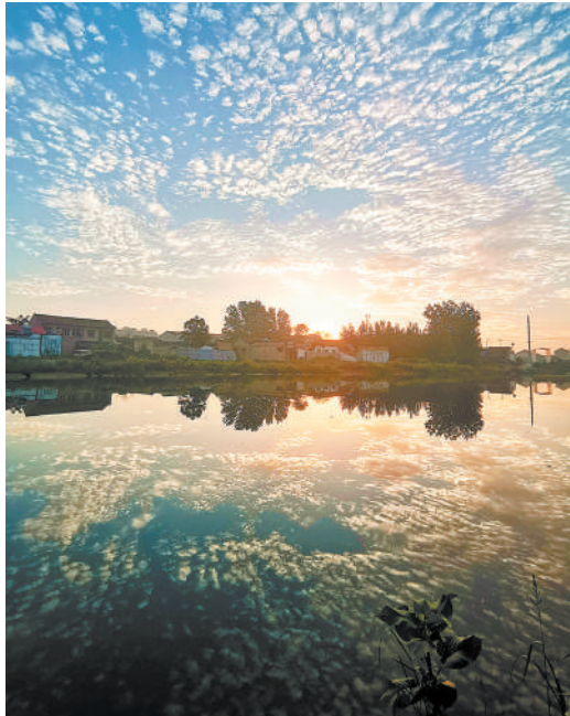
《倒影如画》 美丽的倒影构成一幅优美的画卷。