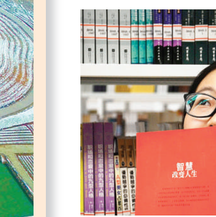
《阅读与人生》 阅读，是一条走向幸福生活的重要人生通道。