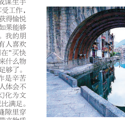
《古镇的“窗”》 透过拱形桥的“窗户”，可以明显感受到古镇多年来的风雨沧桑。