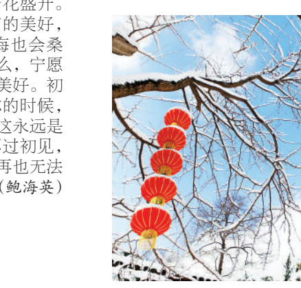
《喜迎新年》 蓝天映衬着白雪、红灯笼，喜迎新年的到来。